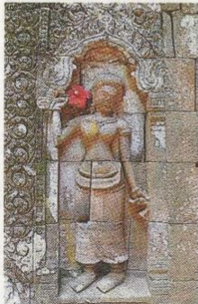
L'une des sculptures du temple de Vat Phou, représentant une divinité féminine.

L'ambassadeur du Laos à Paris était à la bibliothèque, vendredi soir, à l'occasion de la présentation de l'exposition sur les fouilles archéologiques du temple de Vat Phou.